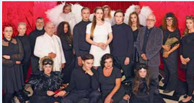
Das Bauhoftheater Braunau – Braunauer Kultursommer 2023

Die ewige Suche nach dem Sinn des Lebens, das gnadenlose Streben nach Erfüllung, ein fast schon krankhafter Jugendwahn und nicht zuletzt der berühmte Pakt mit dem Teufel! Begrüßung und Einführung durch einen der Schauspieler und kleiner Umtrunk vor der Aufführung.